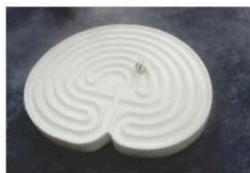
M. Mercier, Sans titre 2013 - dé rond, Corian

Exposition jusqu'au 14 avril 2018 Le Portique, 30 rue Gabriel Péri, Le Havre Ouvert du mardi au samedi, de 14h à 18h30. Entrée libre